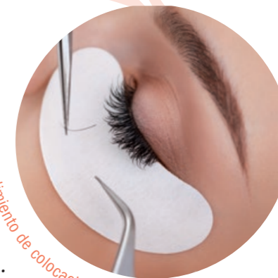
Procedimiento de colocación de las pestañas.

En las tres dimensiones, se colocan tres pelitos por cada uno tuyo natural, triplicando el espesor, la longitud, lo que quieras conseguir. Para las pestañas en tres dimensiones se usará un pelo más fino para conseguir un resultado muy natural, nadie sabrá que no son tuyas.